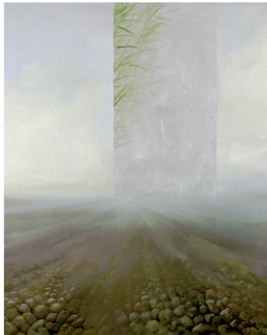
Na działce – staw, olej/srebro/plotno, 100 x 81 cm, 2009