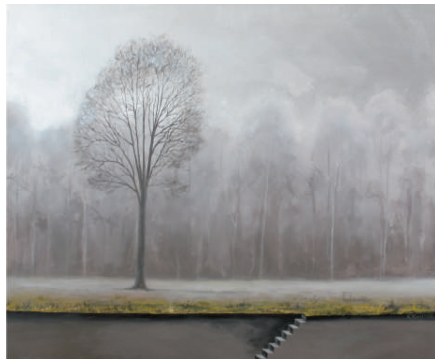
Las - 3, akryl/srebro/plotno, 81 x 100 cm, 2008