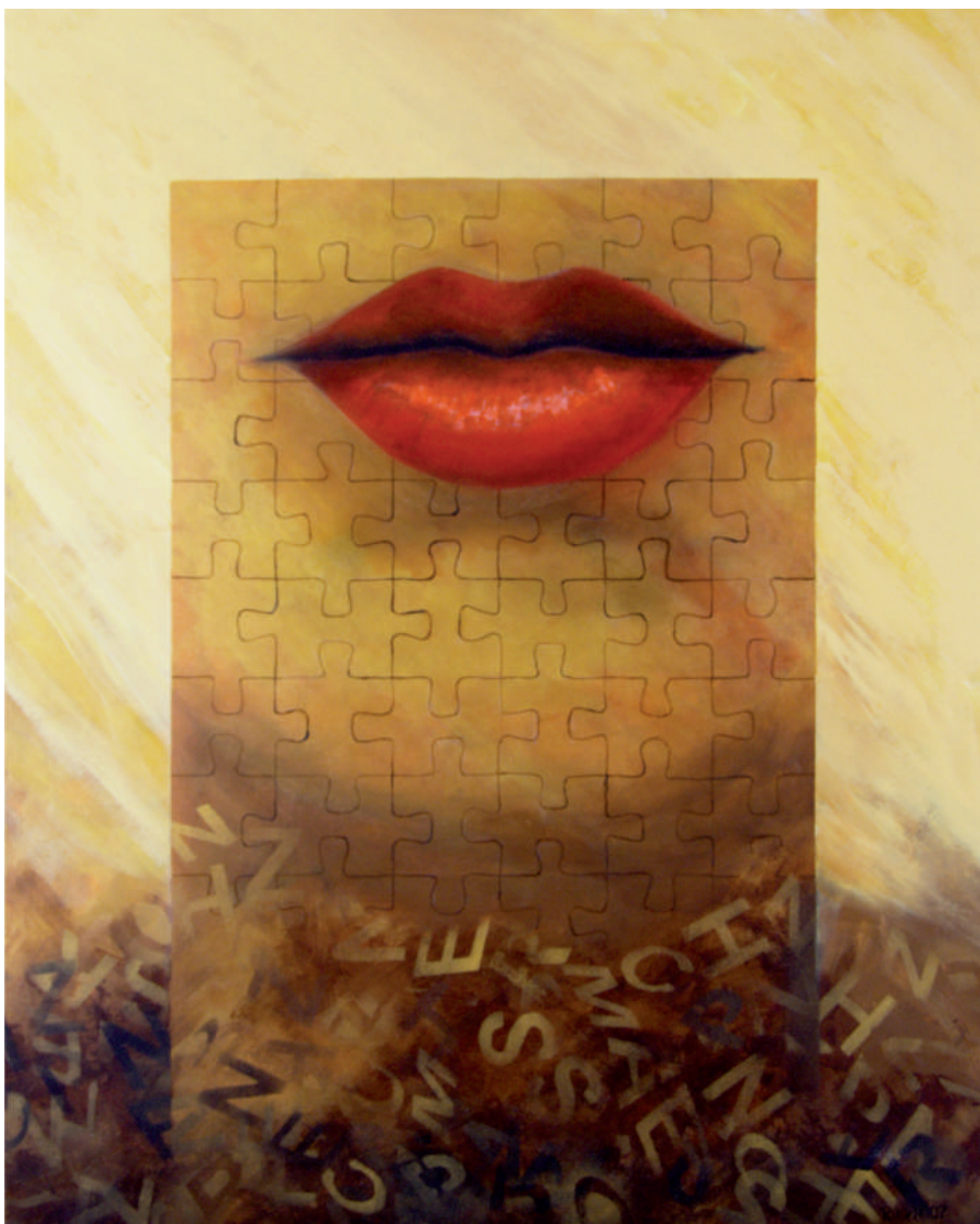
List do przyjaciela – 2, akryl/zioto/plotno, 100 x 81 cm, 2008