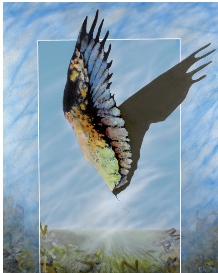
Totemy – 1, olej/srebro/plotno, 100 x 80 cm, 2009