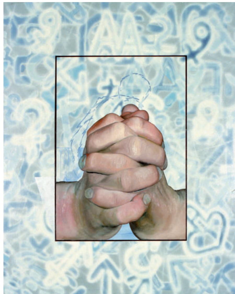
Pierwszy, olej/srebro/plotno, 116 x 97 cm, 1992