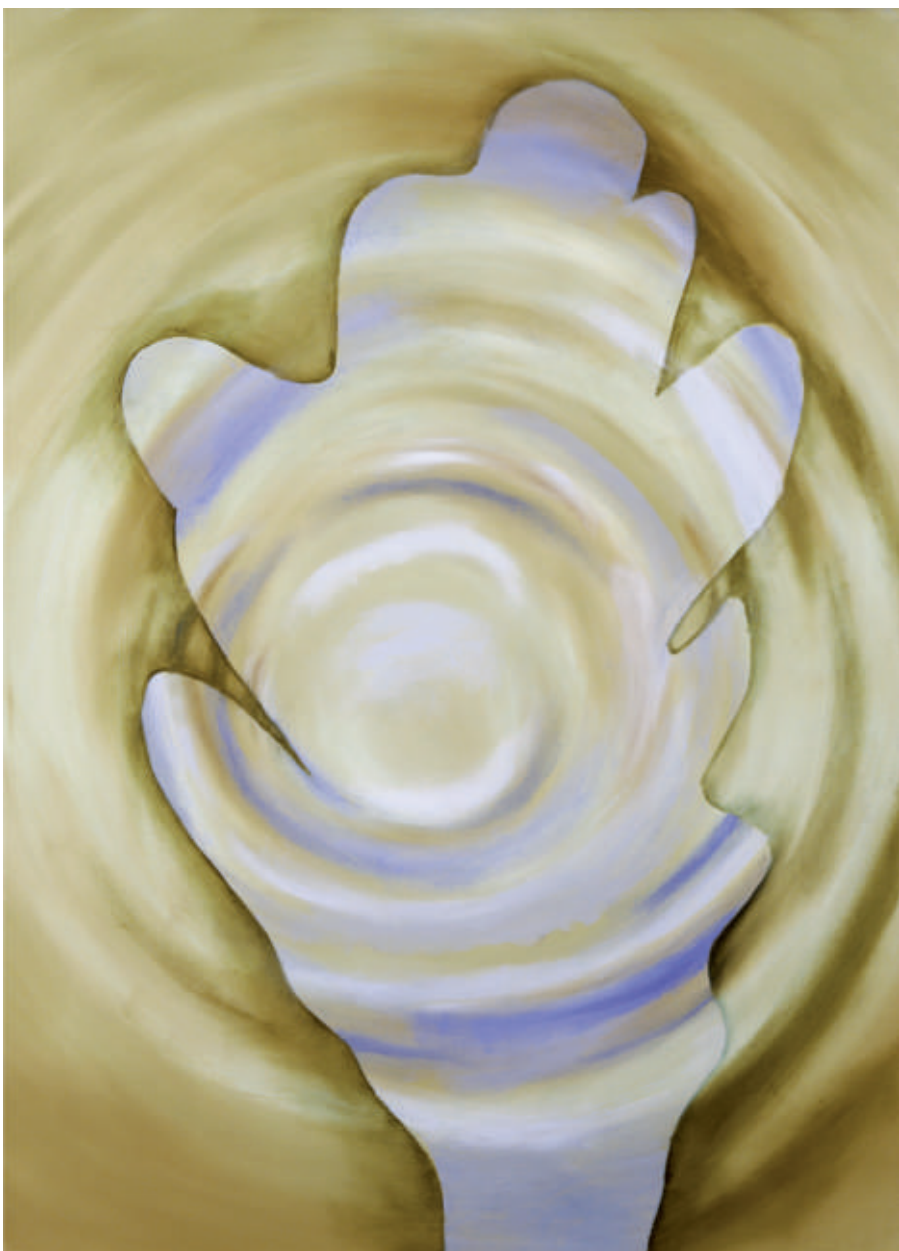
Siedząc na debie – 1, olej/plotno, 73 x 54 cm, 2009