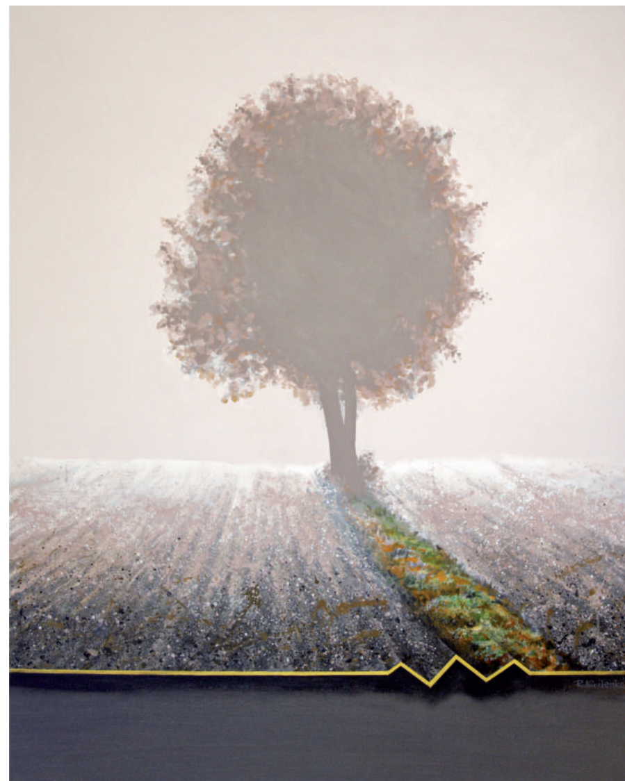
Za miastem – miedza , akryl/płotno, 92 x 73 cm, 2010