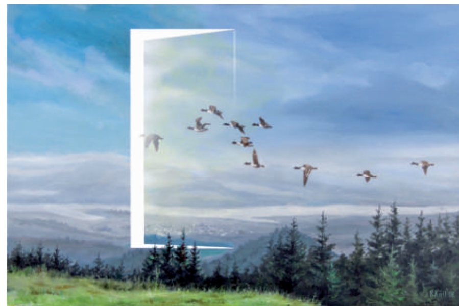
Drzwi, akryl/plotno, 65 x 100 cm, 2007