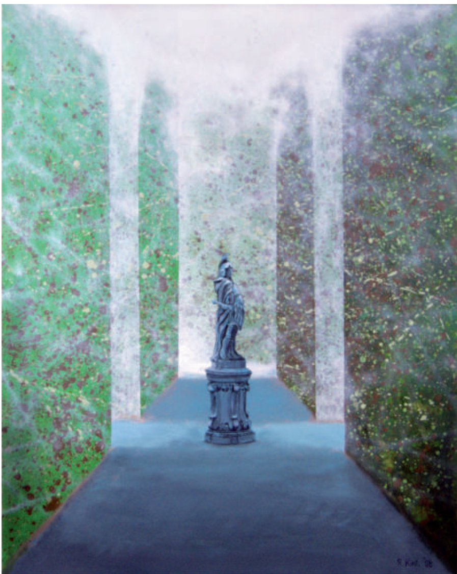
Wilanow – 2, olej/srebro/plotno, 100 x 81 cm, 2008