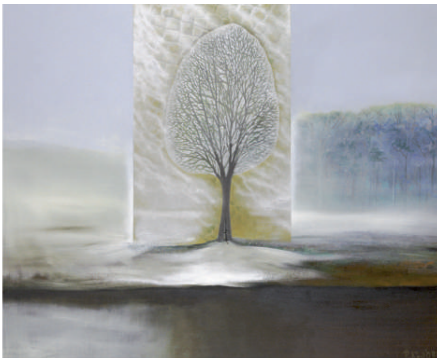
Na działce – 1 , olej/srebro/ płotno, 81 x 100 cm, 2009