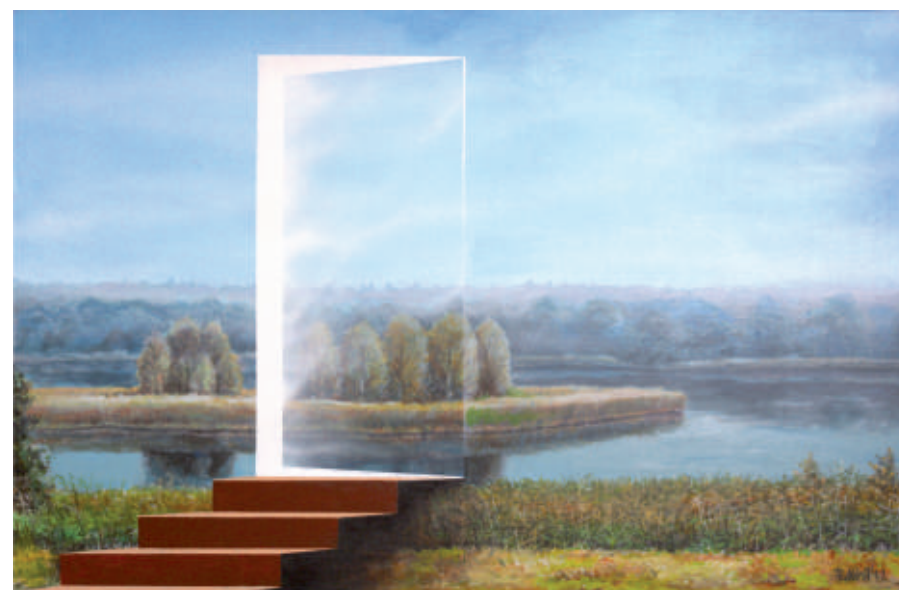
Schody, akryl/olej/plotno, 65 x 100 cm, 2012