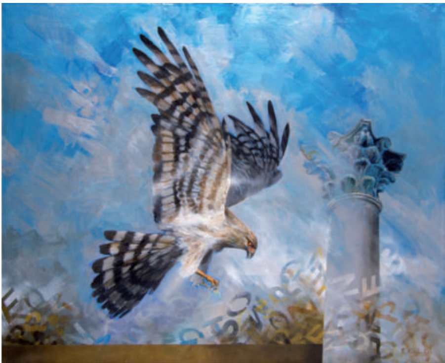
Wilanow – 1 , olej/srebro/plotno, 81 x 100 cm, 2008