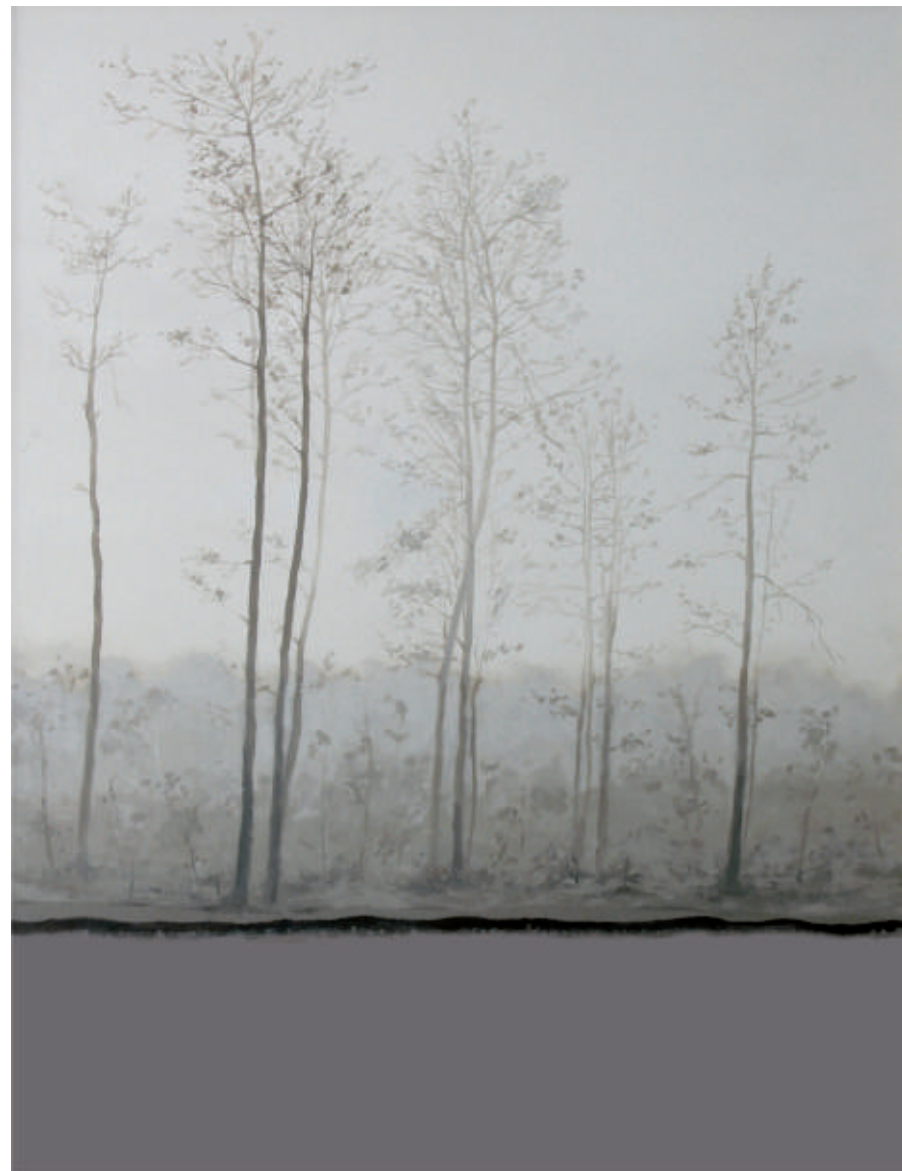
Las – 2 , akryl/plotno, 116 x 97 cm, 2007